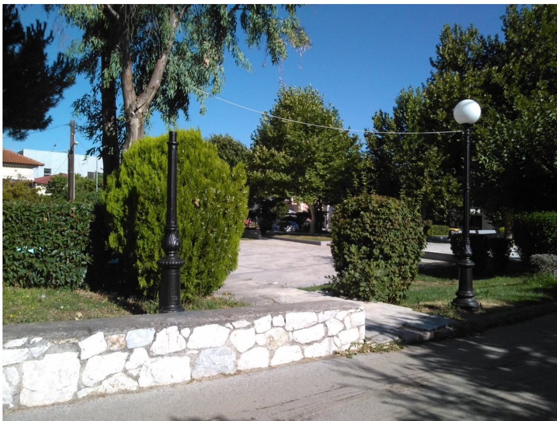
ΦΩΤΟΓΡΑΦΙΑ 8 (Είδη Υποτμήματος Γ3, Άρθρο 8) ΦΩΤΙΣΤΙΚΟ ΣΩΜΑ ΚΕΦΑΛΗΣ ΤΥΠΟΥ ΜΠΑΛΑΣ (ΠΛΑΤΕΙΑ ΔΗΜΟΤΙΚΗΣ ΕΝΟΤΗΤΑΣ ΡΟΔΟΠΟΛΗΣ)