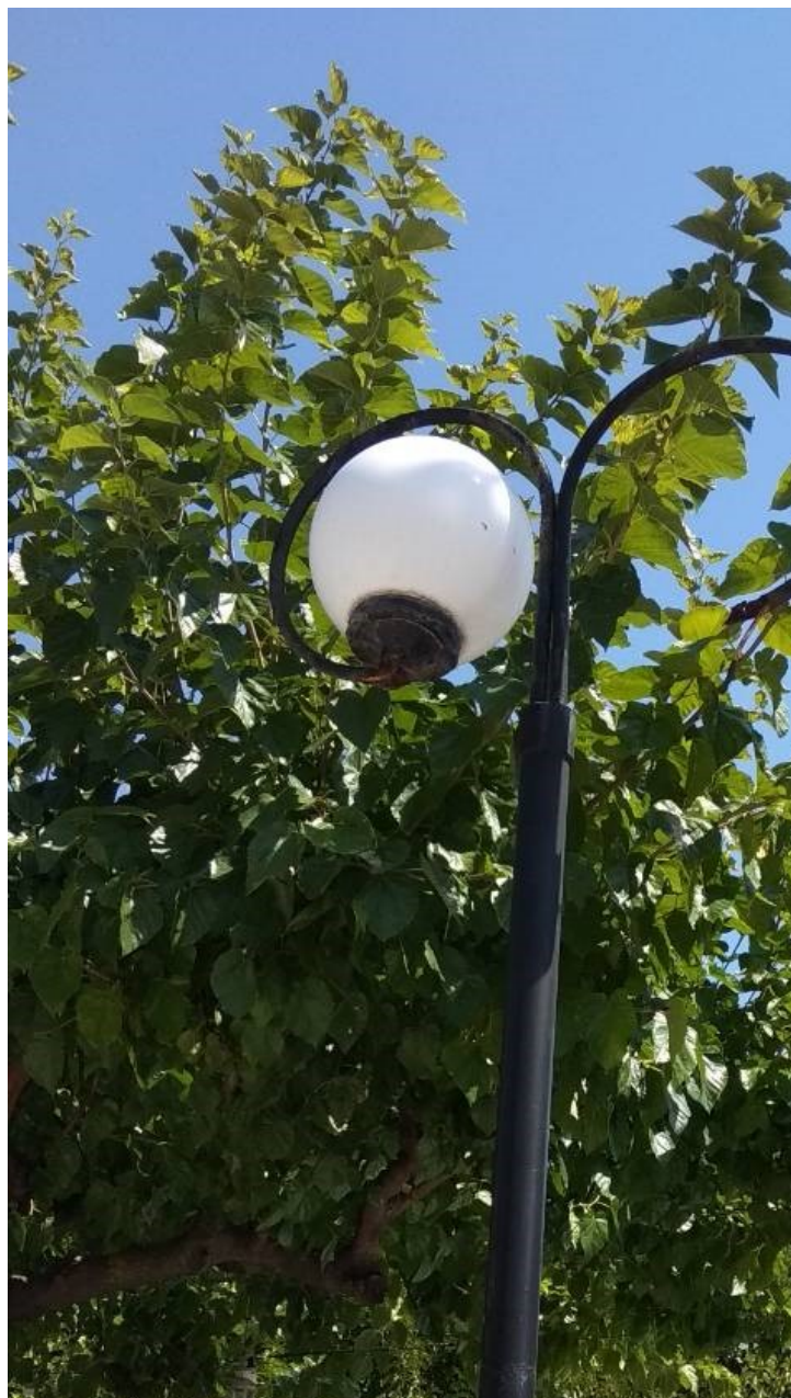
ΦΩΤΟΓΡΑΦΙΑ 9 (Είδη Υποτμήματος Γ3, Άρθρο 9) ΚΕΦΑΛΗ ΜΕ ΒΑΣΗ ΣΤΗΡΙΞΗΣ, ΔΥΟ ΒΡΑΧΙΟΝΕΣ ΚΑΙ ΔΥΟ ΦΩΤΙΣΤΙΚΑ ΜΠΑΛΑΣ Φ300 ΜΜ ΜΕ ΛΑΜΠΤΗΡΕΣ LED (ΟΔΟΣ ΑΛΩΝΙΩΝ ΔΗΜΟΤΙΚΗ ΕΝΟΤΗΤΑ ΣΤΑΜΑΤΑΣ)