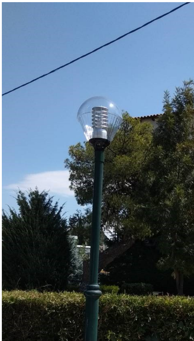
ΦΩΤΟΓΡΑΦΙΑ 1 (Είδη Υπομήματος Γ3, Άρθρο 1 & 2) ΦΩΤΙΣΤΙΚΟ ΤΥΠΟΥ «ΟΥΡΑ» (ΠΛΑΤΕΙΑ ΟΜΟΝΟΙΑΣ ΔΗΜΟΤΙΚΗ ΕΝΟΤΗΤΑ ΑΓ. ΣΤΕΦΑΝΟΥ)