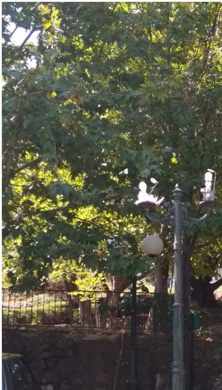
ΦΩΤΟΓΡΑΦΙΑ 3 (Είδη Τμήματος Δ, Άρθρο 4 & 5) ΔΙΠΛΟΣ ΒΡΑΧΙΟΝΑΣ ΜΕ ΔΥΟ ΦΩΤΙΣΤΙΚΑ ΣΩΜΑΤΑ ΤΥΠΟΥ ΜΠΑΛΑΣ Φ300ΜΜ ΜΕ ΛΑΜΠΤΗΡΑ LED (ΑΓ. ΣΩΤΗΡΑ ΔΗΜΟΤΙΚΗ ΕΝΟΤΗΤΑ ΣΤΑΜΑΤΑΣ)