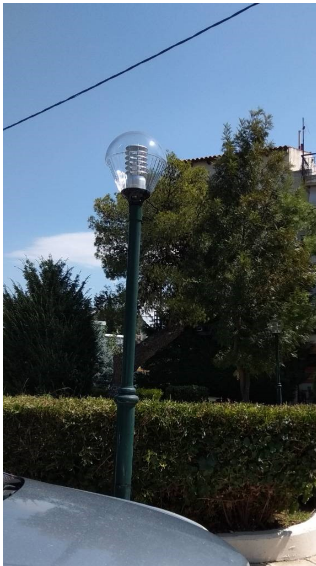
ΦΩΤΟΓΡΑΦΙΑ 1 (Είδη Τμήματος Δ, Άρθρο 1 & 2) ΦΩΤΙΣΤΙΚΟ ΤΥΠΟΥ «ΟΥΡΑ» (ΠΛΑΤΕΙΑ ΟΜΟΝΟΙΑΣ ΔΗΜΟΤΙΚΗ ΕΝΟΤΗΤΑ ΑΓ. ΣΤΕΦΑΝΟΥ)

Επισυνάπτονται φωτογραφίες που αναφέρονται στην Τεχνική Περιγραφή του Τμήματος Δ της παρούσας μελέτης.