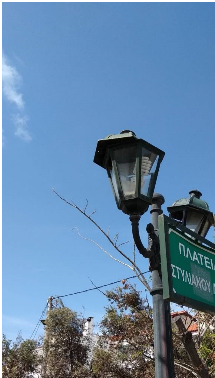
ΦΩΤΟΓΡΑΦΙΑ 4 (Είδη Τμήματος Δ, Άρθρο 6) ΚΕΦΑΛΗ ΜΕ ΒΑΣΗ ΣΤΗΡΙΞΗΣ, ΔΥΟ ΒΡΑΧΙΟΝΕΣ ΚΑΙ ΔΥΟ ΦΩΤΙΣΤΙΚΑ ΤΥΠΟΥ «ΠΑΡΑΔΟΣΙΑΚΟ ΦΑΝΑΡΙ», ΜΕΣΑΙΟ, ΜΕ ΛΑΜΠΤΗΡΕΣ LED (ΠΛΑΤΕΙΑ ΛΙΑΠΗ ΔΗΜΟΤΙΚΗ ΕΝΟΤΗΤΑ ΚΡΥΟΝΕΡΙΟΥ)