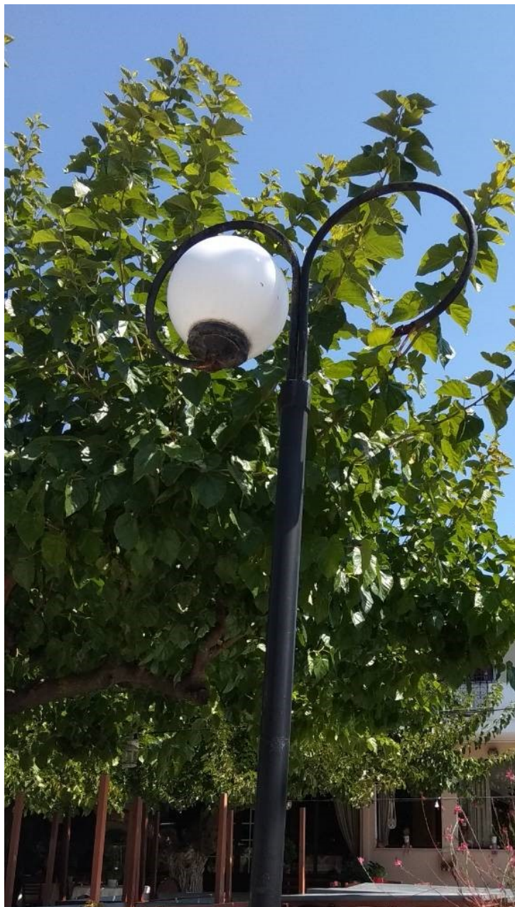
ΦΩΤΟΓΡΑΦΙΑ 8 (Είδη Τμήματος Δ, Άρθρο 11) ΚΕΦΑΛΗ ΜΕ ΒΑΣΗ ΣΤΗΡΙΞΗΣ, ΔΥΟ ΒΡΑΧΙΟΝΕΣ ΚΑΙ ΔΥΟ ΦΩΤΙΣΤΙΚΑ ΜΠΑΛΑΣ Φ300 ΜΜ ΜΕ ΛΑΜΠΤΗΡΕΣ LED (ΟΔΟΣ ΑΛΩΝΙΩΝ ΔΗΜΟΤΙΚΗ ΕΝΟΤΗΤΑ ΣΤΑΜΑΤΑΣ)