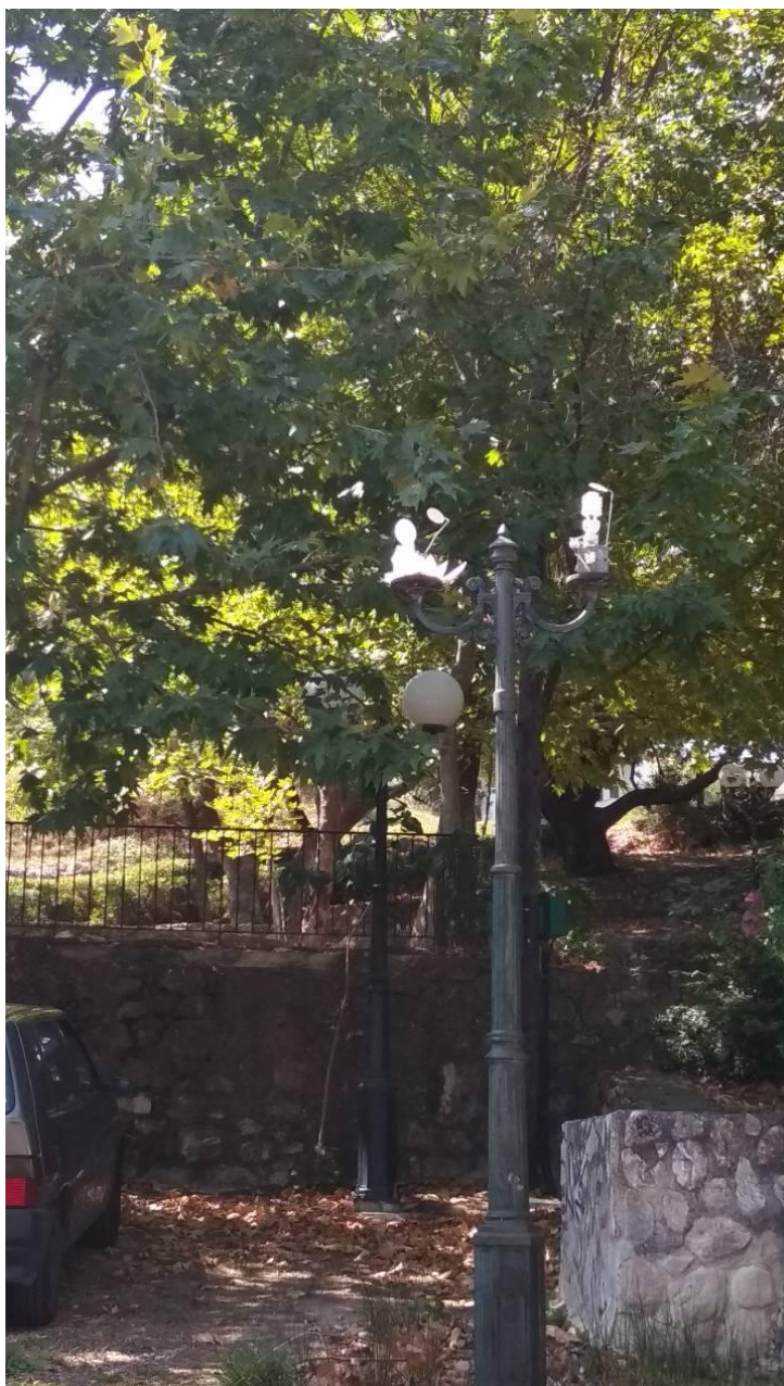
ΦΩΤΟΓΡΑΦΙΑ 14 (Είδη Υπομήματος Γ3, Άρθρο 9) ΚΕΦΑΛΗ ΜΕ ΒΑΣΗ ΣΤΗΡΙΞΗΣ, ΔΥΟ ΒΡΑΧΙΟΝΕΣ ΚΑΙ ΔΥΟ (2) ΦΩΤΙΣΤΙΚΑ ΣΩΜΑΤΑ Φ300 ΜΕ ΛΑΜΠΤΗΡΕΣ LED (ΟΔΟΣ ΜΕΓΑΛΟΥ ΑΛΕΞΑΝΔΡΟΥ ΔΗΜΟΤΙΚΗ ΕΝΟΤΗΤΑ ΣΤΑΜΑΤΑΣ)