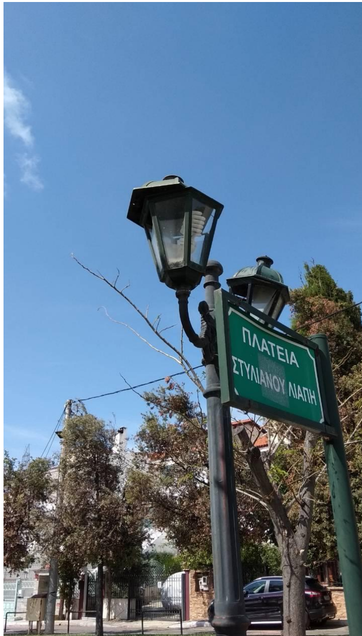
ΦΩΤΟΓΡΑΦΙΑ 5 (Είδη Υποτήματος Γ3, Άρθρο 5) ΚΕΦΑΛΗ ΜΕ ΒΑΣΗ ΣΤΗΡΙΞΗΣ, ΔΥΟ ΒΡΑΧΙΟΝΕΣ ΚΑΙ ΔΥΟ ΦΩΤΙΣΤΙΚΑ ΤΥΠΟΥ «ΠΑΡΑΔΟΣΙΑΚΟ ΦΑΝΑΡΙ», ΜΕΣΑΙΟ, ΜΕ ΛΑΜΠΤΗΡΕΣ LED (ΠΛΑΤΕΙΑ ΛΙΑΠΗ ΔΗΜΟΤΙΚΗ ΕΝΟΤΗΤΑ ΚΡΥΟΝΕΡΙΟΥ)

ΔΙΠΛΟΣ ΒΡΑΧΙΟΝΑΣ ΜΕ ΔΥΟ ΦΩΤΙΣΤΙΚΑ ΣΩΜΑΤΑ ΤΥΠΟΥ ΜΠΑΛΑΣ Φ300ΜΜ ΜΕ ΛΑΜΠΤΗΡΑ LED (ΑΓ. ΣΩΤΗΡΑ ΔΗΜΟΤΙΚΗ ΕΝΟΤΗΤΑ ΣΤΑΜΑΤΑΣ)