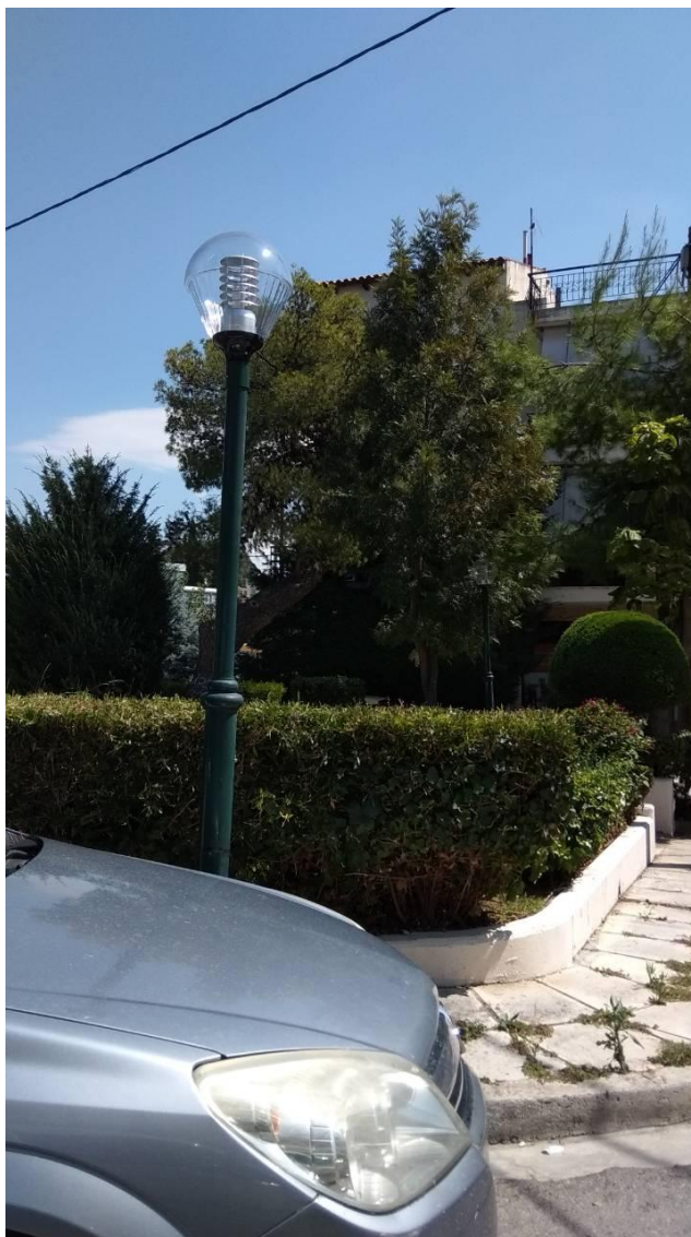
ΦΩΤΟΓΡΑΦΙΑ 1 (Είδη Υπομήματος Γ3, Άρθρο 1 & 2) ΦΩΤΙΣΤΙΚΟ ΤΥΠΟΥ «ΟΥΡΑ» (ΠΛΑΤΕΙΑ ΟΜΟΝΟΙΑΣ ΔΗΜΟΤΙΚΗ ΕΝΟΤΗΤΑ ΑΓ. ΣΤΕΦΑΝΟΥ)

Επισυνάπτονται φωτογραφίες που αναφέρονται στην Τεχνική Περιγραφή του Τμήματος Γ, Υπομήμα Γ3 και Γ4 της παρούσας Μελέτης.