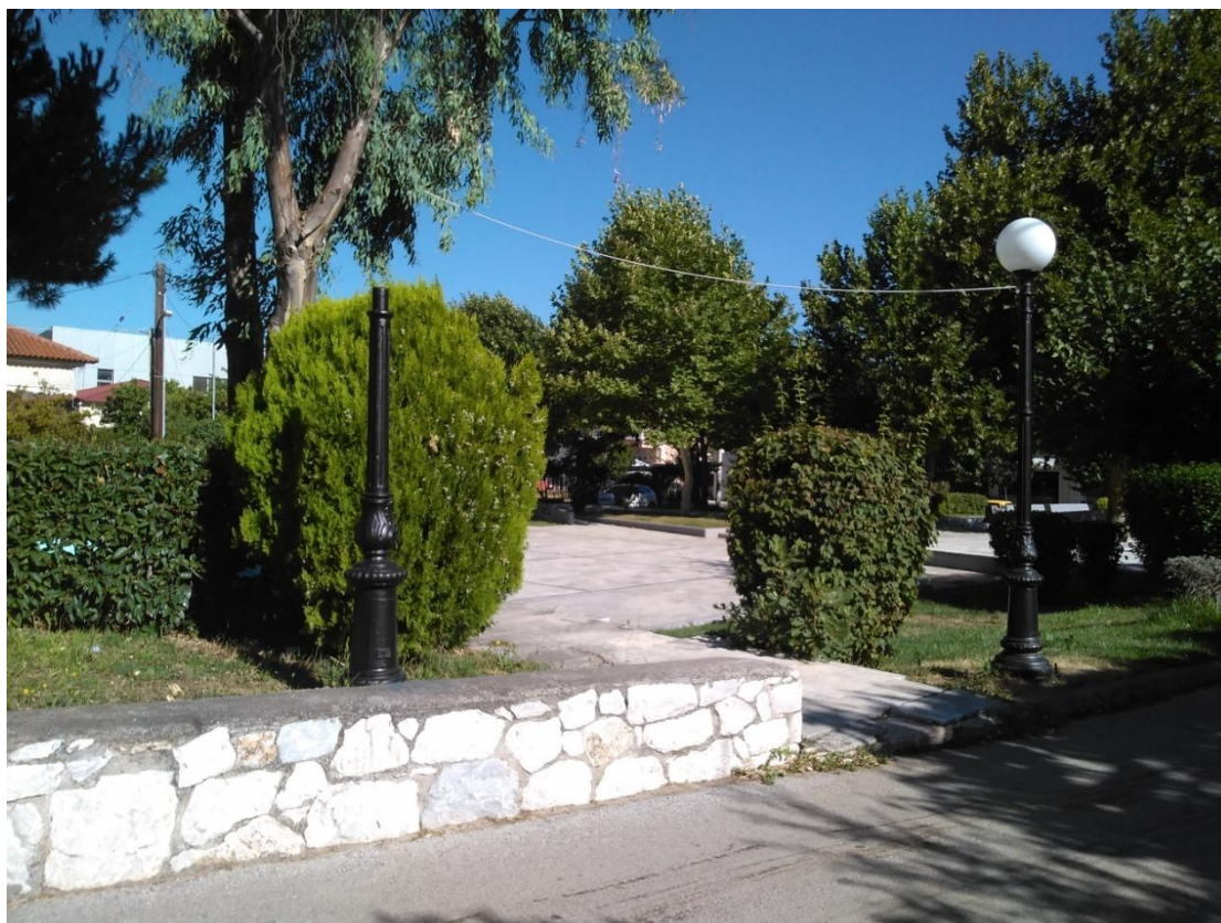
ΦΩΤΟΓΡΑΦΙΑ 8 (Είδη Υπομνήματος Γ3, Άρθρο 8) ΦΩΤΙΣΤΙΚΟ ΣΩΜΑ ΚΕΦΑΛΗΣ ΤΥΠΟΥ ΜΠΑΛΑΣ (ΠΛΑΤΕΙΑ ΔΗΜΟΤΙΚΗΣ ΕΝΟΤΗΤΑΣ ΡΟΔΟΠΟΛΗΣ)