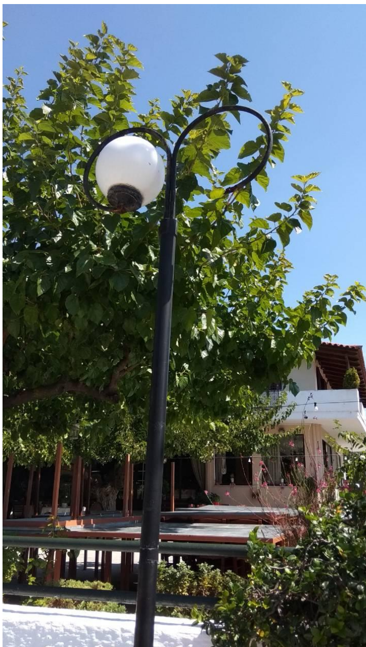
ΦΩΤΟΓΡΑΦΙΑ 9 (Είδη Υπομήματος Γ3, Άρθρο 9) ΚΕΦΑΛΗ ΜΕ ΒΑΣΗ ΣΤΗΡΙΞΗΣ, ΔΥΟ ΒΡΑΧΙΟΝΕΣ ΚΑΙ ΔΥΟ ΦΩΤΙΣΤΙΚΑ ΜΠΑΛΑΣ Φ300 ΜΜ ΜΕ ΛΑΜΠΤΗΡΕΣ LED (ΟΔΟΣ ΑΛΩΝΙΩΝ ΔΗΜΟΤΙΚΗ ΕΝΟΤΗΤΑ ΣΤΑΜΑΤΑΣ)