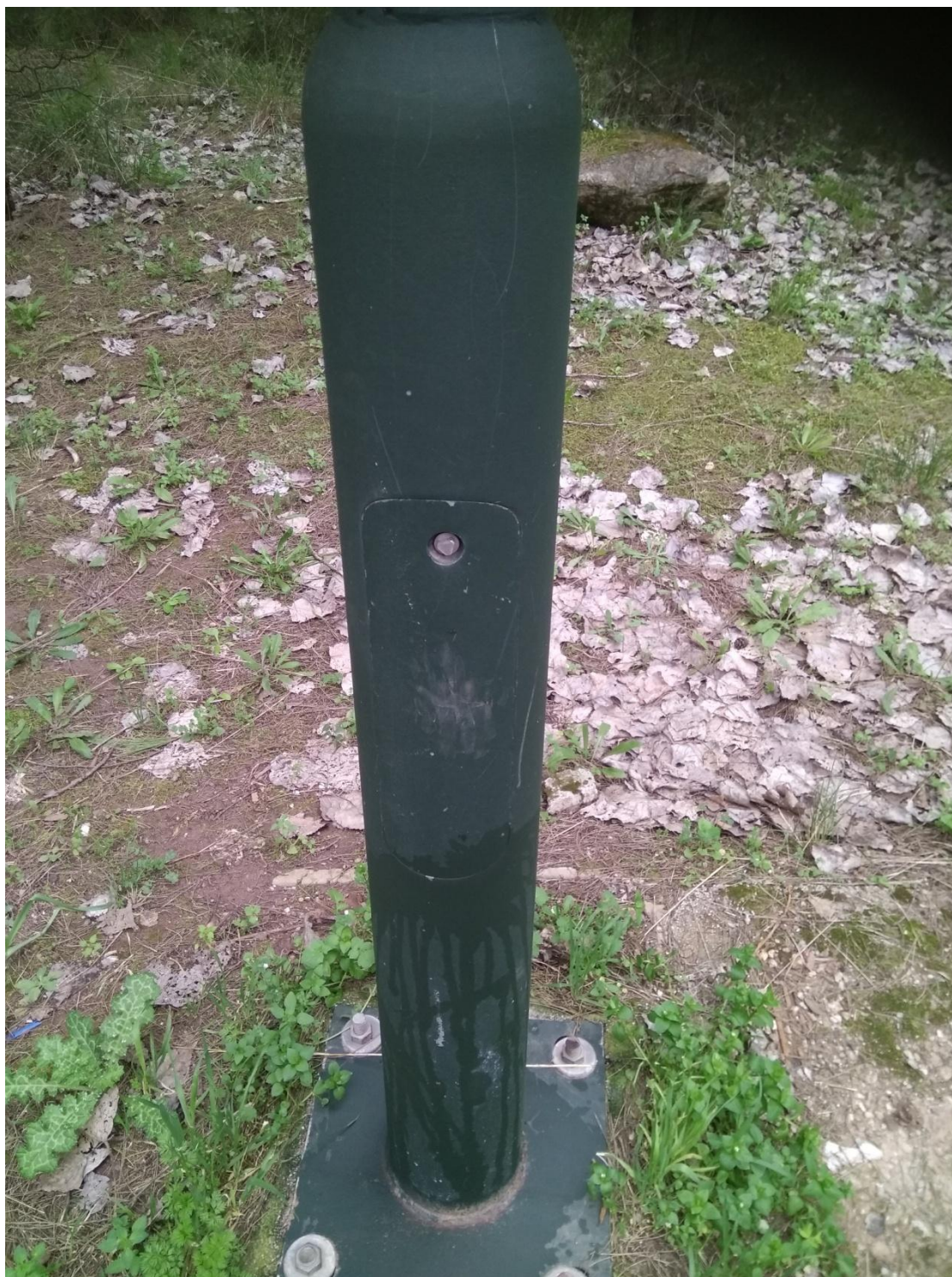
ΦΩΤΟΓΡΑΦΙΑ 16 (Είδη Υποτμήματος Γ4, Άρθρο 12/13/14) ΠΟΡΤΑ ΙΣΤΟΥ (ΠΕΡΙΒΑΛΛΟΝ ΧΩΡΟΣ ΓΗΠΕΔΟΥ ΔΗΜΟΤΙΚΗΣ ΕΝΟΤΗΤΑ ΔΡΟΣΙΑΣ)