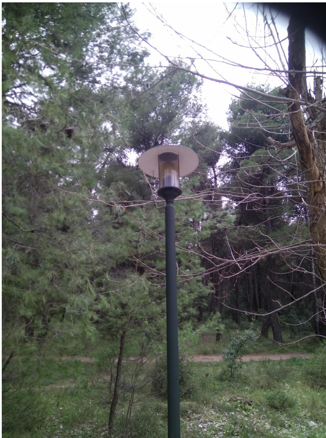
ΦΩΤΟΓΡΑΦΙΑ 13 (Είδη Υποτμήματος Γ3, Άρθρο 13) ΦΩΤΙΣΤΙΚΟΥ ΣΩΜΑΤΟΣ ΚΕΦΑΛΗΣ ΑΛΟΥΜΙΝΙΟΥ ΜΕ ΑΤΣΑΛΙΝΟ ΚΑΠΕΛΟ ΓΙΑ ΛΑΜΠΤΗΡΑ ΤΥΠΟΥ E27 LED ΠΕΡΙΒΑΛΛΟΝ ΧΩΡΟΣ ΓΗΠΕΔΟΥ ΔΗΜΟΤΙΚΗΣ ΕΝΟΤΗΤΑΣ ΔΡΟΣΙΑΣ