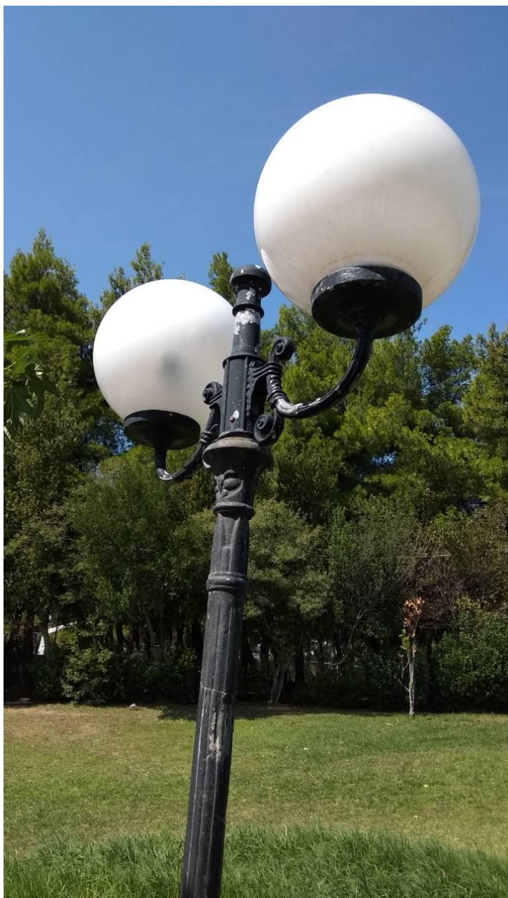
ΦΩΤΟΓΡΑΦΙΑ 2 (Είδη Υποτμήματος Γ3, Άρθρο 9) ΚΕΦΑΛΗ ΜΕ ΒΑΣΗ ΣΤΗΡΙΞΗΣ, ΔΥΟ ΒΡΑΧΙΟΝΕΣ ΚΑΙ ΔΥΟ ΦΩΤΙΣΤΙΚΑ ΜΠΑΛΑΣ Φ300ΜΜ ΜΕ ΛΑΜΠΤΗΡΕΣ LED (ΠΛΑΤΕΙΑ Ν. ΠΛΑΣΤΗΡΑ ΔΗΜΟΤΙΚΗ ΕΝΟΤΗΤΑ ΚΡΥΟΝΕΡΙΟΥ)