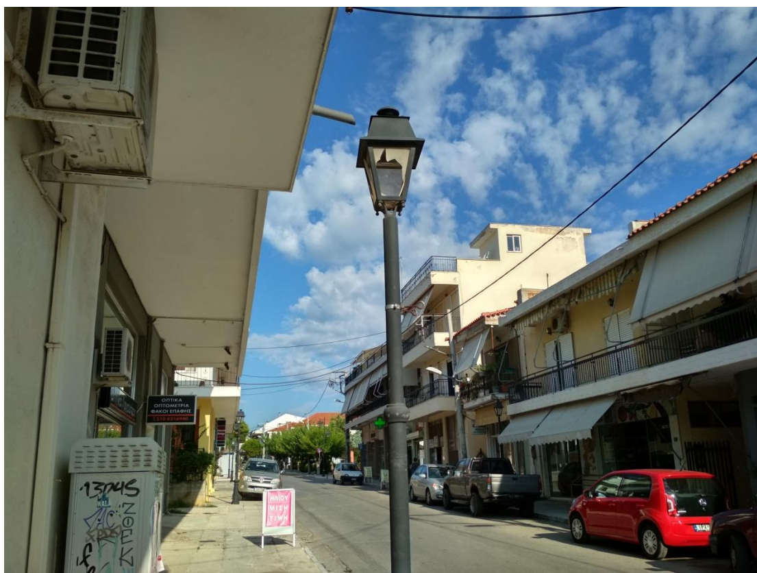
ΦΩΤΟΓΡΑΦΙΑ 3 (Είδη Υποτμήματος Γ3, Άρθρο 3) ΦΩΤΙΣΤΙΚΟ ΣΩΜΑ ΑΛΟΥΜΙΝΙΟΥ ΤΥΠΟΥ «ΜΙΚΡΟ ΠΑΡΑΔΟΣΙΑΚΟ ΦΑΝΑΡΙ» 70WNA (ΟΔΟΣ ΚΟΙΜΗΣΕΩΣ ΤΗΣ ΘΕΤΟΚΟΥ ΔΗΜΟΤΙΚΗ ΕΝΟΤΗΤΑ ΑΓ. ΣΤΕΦΑΝΟΥ)