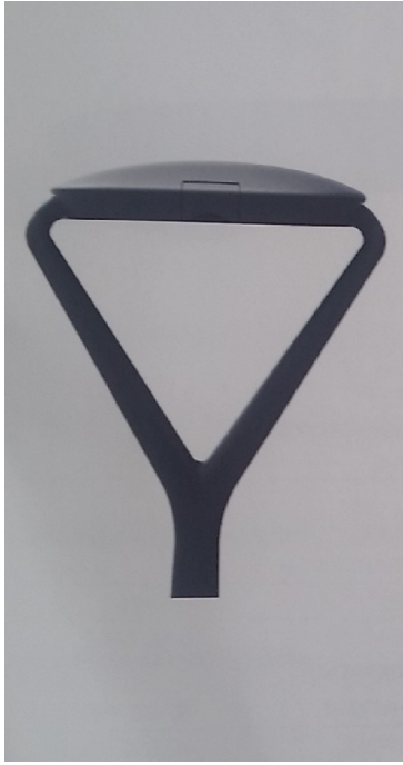
ΦΩΤΟΓΡΑΦΙΑ 17 ΦΩΤΙΣΤΙΚΟ ΣΩΜΑ ΠΛΑΤΕΙΑΣ I 50W