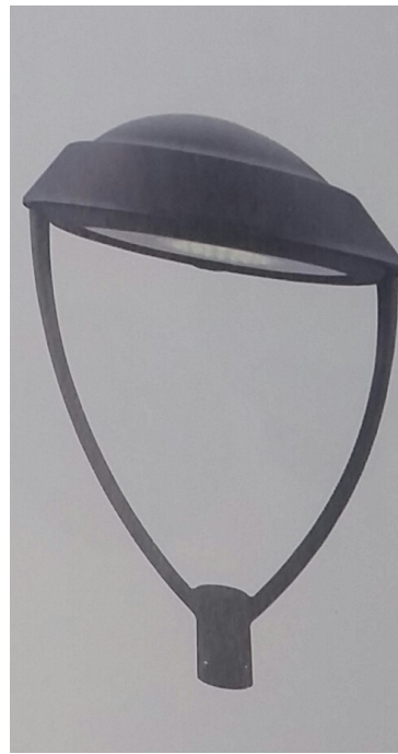
ΦΩΤΟΓΡΑΦΙΑ 20 ΦΩΤΙΣΤΙΚΟ ΠΛΑΤΕΙΑΣ IV 70W