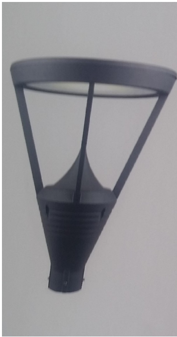
ΦΩΤΟΓΡΑΦΙΑ 19 ΦΩΤΙΣΤΙΚΟ ΠΛΑΤΕΙΑΣ III 70W