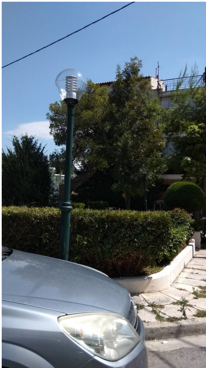
ΦΩΤΟΓΡΑΦΙΑ 1 ΦΩΤΙΣΤΙΚΟ ΤΥΠΟΥ «ΟΥΡΑ» (ΠΛΑΤΕΙΑ ΟΜΟΝΟΙΑΣ ΔΗΜΟΤΙΚΗ ΕΝΟΤΗΤΑ ΑΓ. ΣΤΕΦΑΝΟΥ)

Επισυνάπτονται φωτογραφίες που αναφέρονται στην Τεχνική Περιγραφή της παρούσας μελέτης.