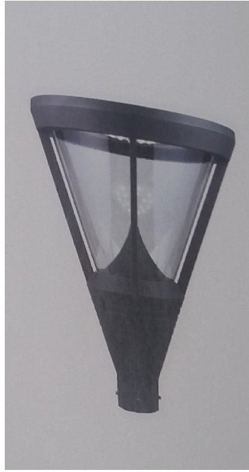
ΦΩΤΟΓΡΑΦΙΑ 18 ΦΩΤΙΣΤΙΚΟ ΣΩΜΑ ΠΛΑΤΕΙΑΣ II 70W