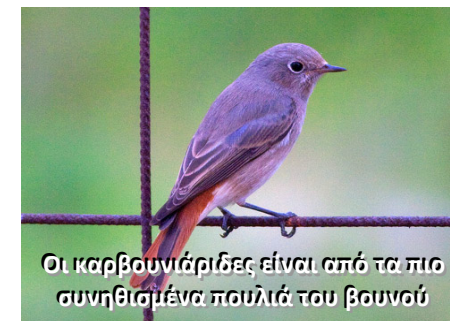
Οι καρβουνιάριδες είναι από τα πιο συνηθισμένα πουλιά του βουνού