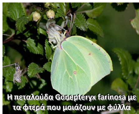
Η πεταλούδα Gossypium hirsutum με τα φτερά που μοιάζουν με φύλλα