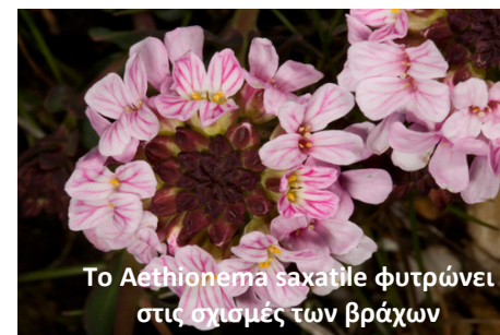
Το Aethionema saxatile φυτρώνει στις σχισμές των βράχων