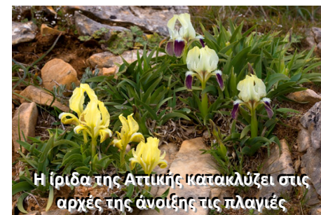
Η ίριδα της Αττικής κατακλύζει στις αρχές της άνοιξης τις πλαγιές