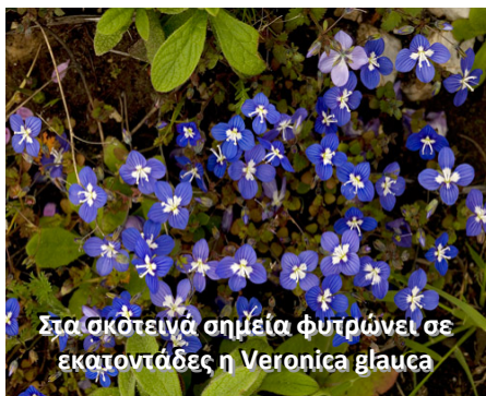
Στα σκότεινά σημεία φυτρώνει σε εκατοντάδες η Veronica glauca