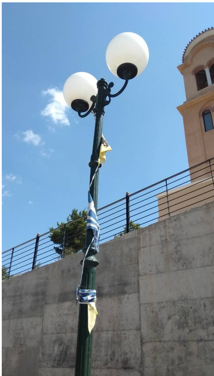
ΦΩΤΟΓΡΑΦΙΑ 15 (Είδη Υποτμήματος Γ3, Άρθρο 9) ΚΕΦΑΛΗ ΜΕ ΒΑΣΗ ΣΤΗΡΙΞΗΣ, ΔΥΟ ΒΡΑΧΙΟΝΕΣ ΚΑΙ ΔΥΟ (2) ΦΩΤΙΣΤΙΚΑ ΣΩΜΑΤΑ Φ300 ΜΕ ΛΑΜΠΤΗΡΕΣ LED (ΟΔΟΣ ΜΕΓΑΛΟΥ ΑΛΕΞΑΝΔΡΟΥ ΔΗΜΟΤΙΚΗ ΕΝΟΤΗΤΑ ΣΤΑΜΑΤΑΣ)