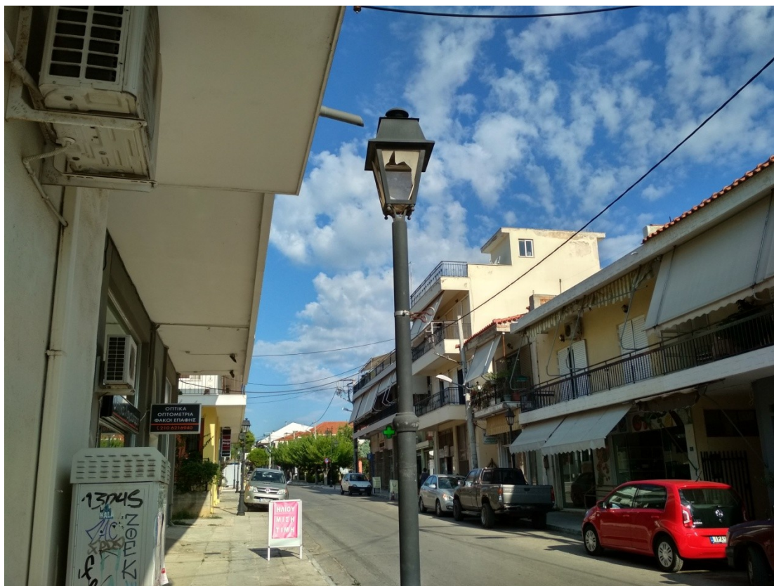
ΦΩΤΟΓΡΑΦΙΑ 3 (Είδη Υποτμήματος Γ3, Άρθρο 3) ΦΩΤΙΣΤΙΚΟ ΣΩΜΑ ΑΛΟΥΜΙΝΙΟΥ ΤΥΠΟΥ «ΜΙΚΡΟ ΠΑΡΑΔΟΣΙΑΚΟ ΦΑΝΑΡΙ» 70WNA (ΟΔΟΣ ΚΟΙΜΗΣΕΩΣ ΤΗΣ ΘΕΤΟΚΟΥ ΔΗΜΟΤΙΚΗ ΕΝΟΤΗΤΑ ΑΓ. ΣΤΕΦΑΝΟΥ)