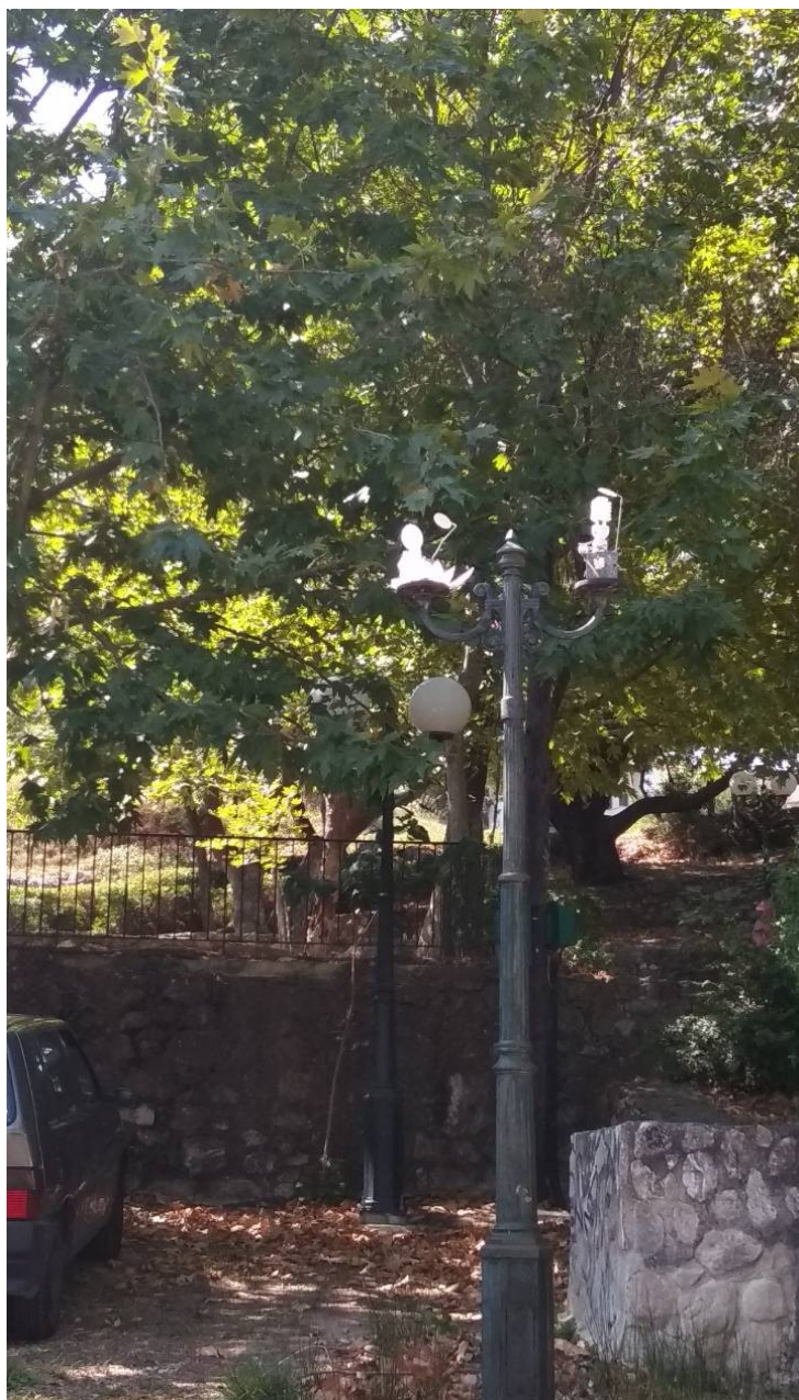
ΦΩΤΟΓΡΑΦΙΑ 14 (Είδη Υπομήματος Γ3, Άρθρο 9) ΚΕΦΑΛΗ ΜΕ ΒΑΣΗ ΣΤΗΡΙΞΗΣ, ΔΥΟ ΒΡΑΧΙΟΝΕΣ ΚΑΙ ΔΥΟ (2) ΦΩΤΙΣΤΙΚΑ ΣΩΜΑΤΑ Φ300 ΜΕ ΛΑΜΠΤΗΡΕΣ LED (ΟΔΟΣ ΜΕΓΑΛΟΥ ΑΛΕΞΑΝΔΡΟΥ ΔΗΜΟΤΙΚΗ ΕΝΟΤΗΤΑ ΣΤΑΜΑΤΑΣ)