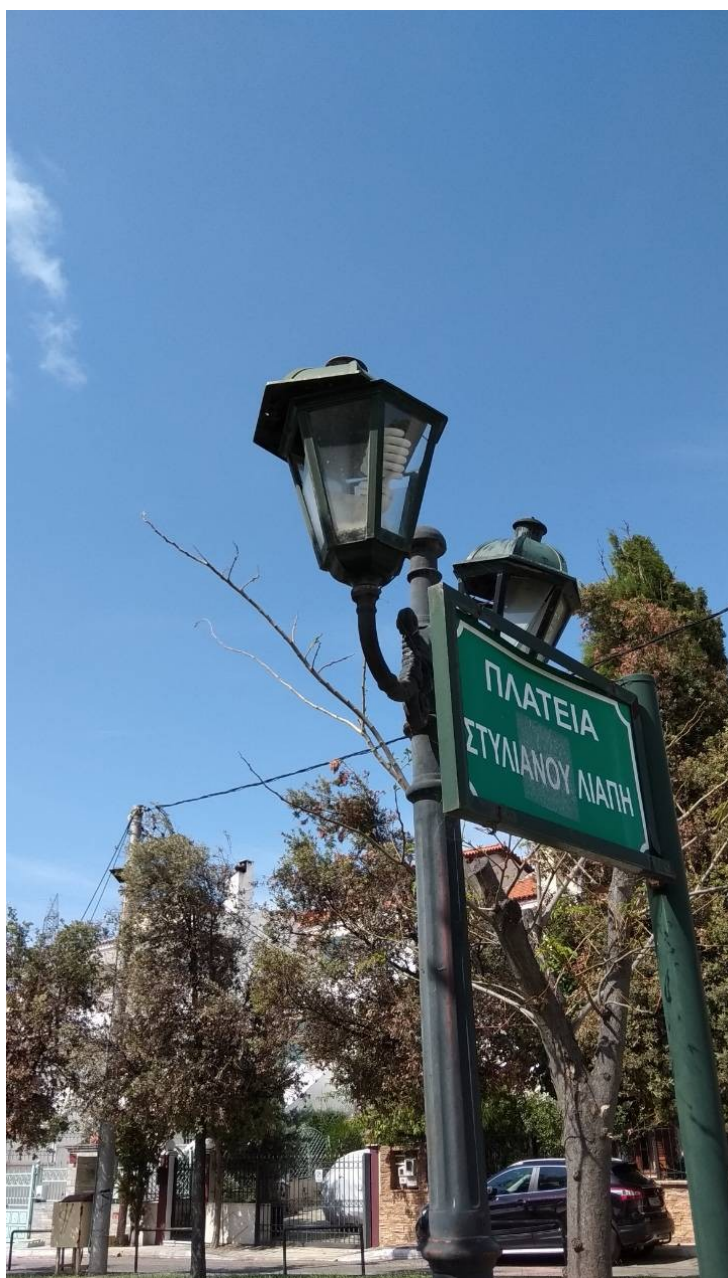
ΦΩΤΟΓΡΑΦΙΑ 5 (Είδη Υπομήματος Γ3, Άρθρο 5) ΚΕΦΑΛΗ ΜΕ ΒΑΣΗ ΣΤΗΡΙΞΗΣ, ΔΥΟ ΒΡΑΧΙΟΝΕΣ ΚΑΙ ΔΥΟ ΦΩΤΙΣΤΙΚΑ ΤΥΠΟΥ «ΠΑΡΑΔΟΣΙΑΚΟ ΦΑΝΑΡΙ», ΜΕΣΑΙΟ, ΜΕ ΛΑΜΠΤΗΡΕΣ LED (ΠΛΑΤΕΙΑ ΛΙΑΠΗ ΔΗΜΟΤΙΚΗ ΕΝΟΤΗΤΑ ΚΡΥΟΝΕΡΙΟΥ)