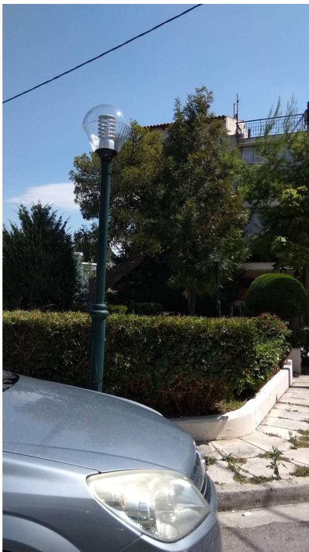
ΦΩΤΟΓΡΑΦΙΑ 1 (Είδη Υποτμήματος Γ3, Άρθρο 1 & 2) ΦΩΤΙΣΤΙΚΟ ΤΥΠΟΥ «ΟΥΡΑ» (ΠΛΑΤΕΙΑ ΟΜΟΝΟΙΑΣ ΔΗΜΟΤΙΚΗ ΕΝΟΤΗΤΑ ΑΓ. ΣΤΕΦΑΝΟΥ)