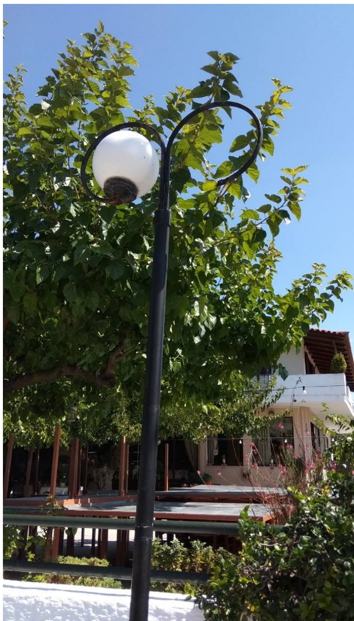
ΦΩΤΟΓΡΑΦΙΑ 9 (Είδη Υπομήματος Γ3, Άρθρο 9) ΚΕΦΑΛΗ ΜΕ ΒΑΣΗ ΣΤΗΡΙΞΗΣ, ΔΥΟ ΒΡΑΧΙΟΝΕΣ ΚΑΙ ΔΥΟ ΦΩΤΙΣΤΙΚΑ ΜΠΑΛΑΣ Φ300 ΜΜ ΜΕ ΛΑΜΠΤΗΡΕΣ LED (ΟΔΟΣ ΑΛΩΝΙΩΝ ΔΗΜΟΤΙΚΗ ΕΝΟΤΗΤΑ ΣΤΑΜΑΤΑΣ)