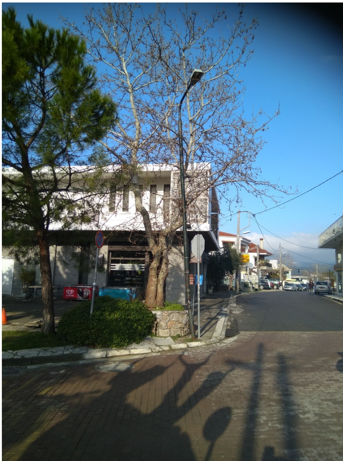
ΦΩΤΟΓΡΑΦΙΑ 11 (Είδη Υπομήματος Γ3, Άρθρο 11) ΧΑΛΥΒΔΙΝΟΣ ΙΣΤΟΣ ΟΔΟΦΩΤΙΣΜΟΥ ΥΨΟΥΣ 6 – 8 Μ - ΦΩΤΙΣΤΙΚΟ ΣΩΜΑ ΒΡΑΧΙΟΝΑ LED ( ΠΛΑΤΕΙΑ ΑΝΟΙΞΗΣ ΔΗΜΟΤΙΚΗΣ ΕΝΟΤΗΤΑ ΑΝΟΙΞΗΣ)